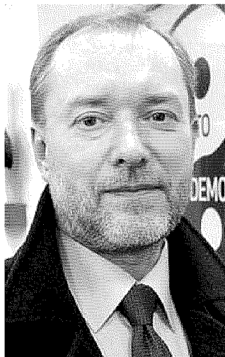
L'autore Giorgio Vallortigara